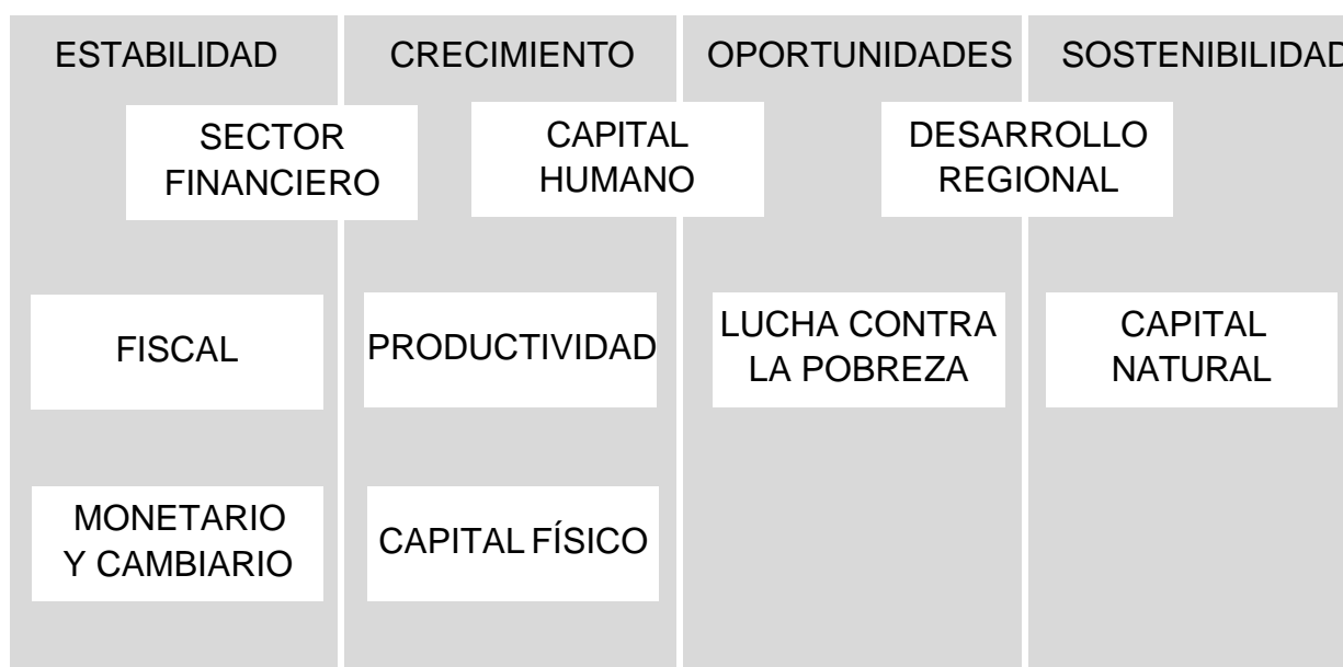
DIAGRAMA DE MACRO ÁREAS DE ACCIÓN DEL PLAN NACIONAL DE DESARROLLO HUMANO

Cada uno de los cuatro pilares ( estabilidad, crecimiento, oportunidades y sostenibilidad ) de la estrategia del PNDH, se ha dividido en macro áreas de acción representadas en el siguiente diagrama. Esas áreas corresponden a programas generales de política que se toman en consideración en el proceso de búsqueda del desarrollo del país. A continuación se describen brevemente los principales objetivos que se persiguen en cada una de estas macro áreas.